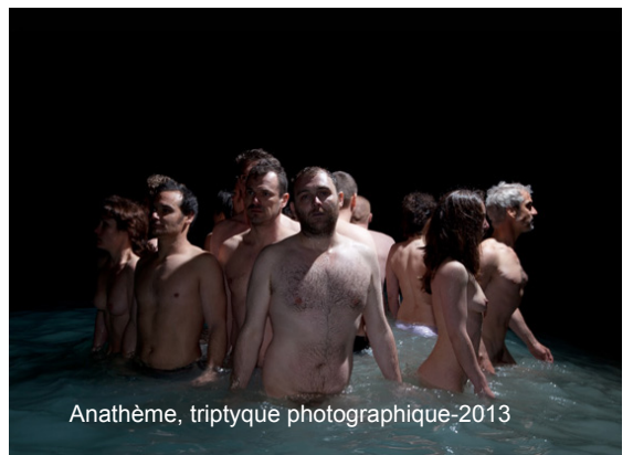
Anathème, triptyque photographique-2013