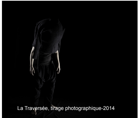
La Traversée, tirage photographique-2014