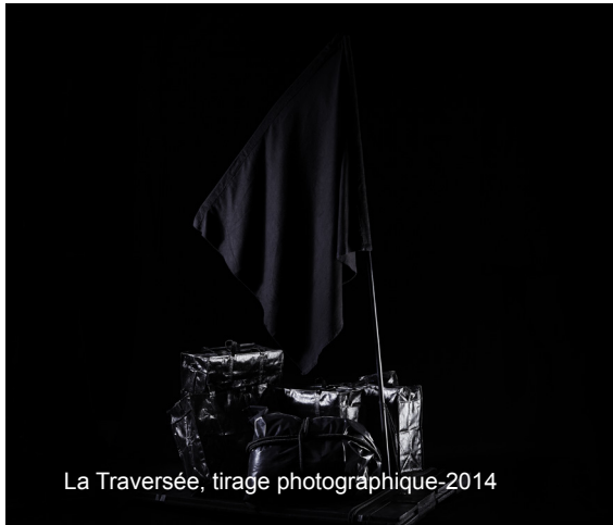
La Traversée, tirage photographique-2014