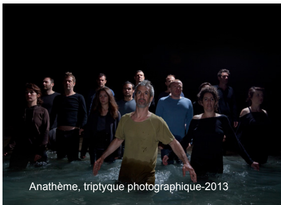
Anathème, triptyque photographique-2013