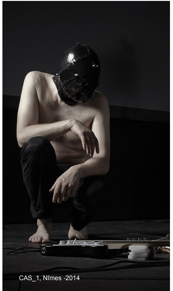
CAS_1, Nîmes -2014