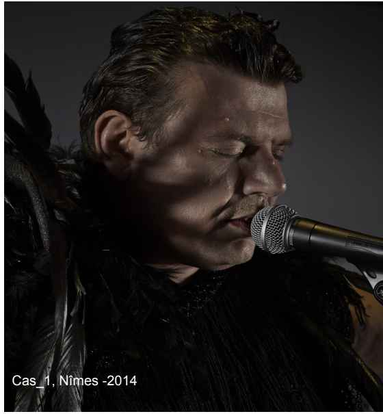
Cas_1, Nimes -2014