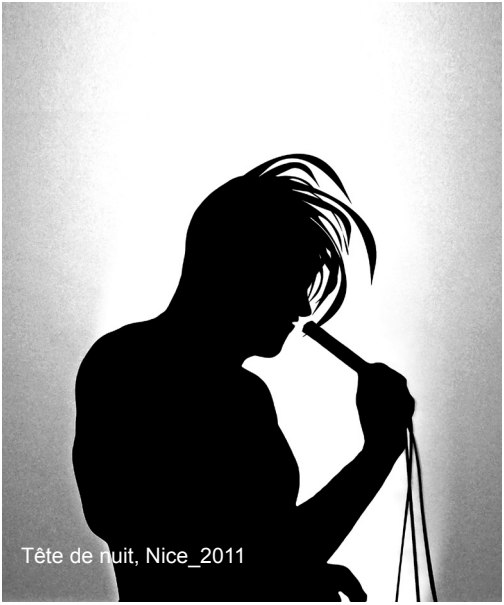
Tête de nuit, Nice_2011